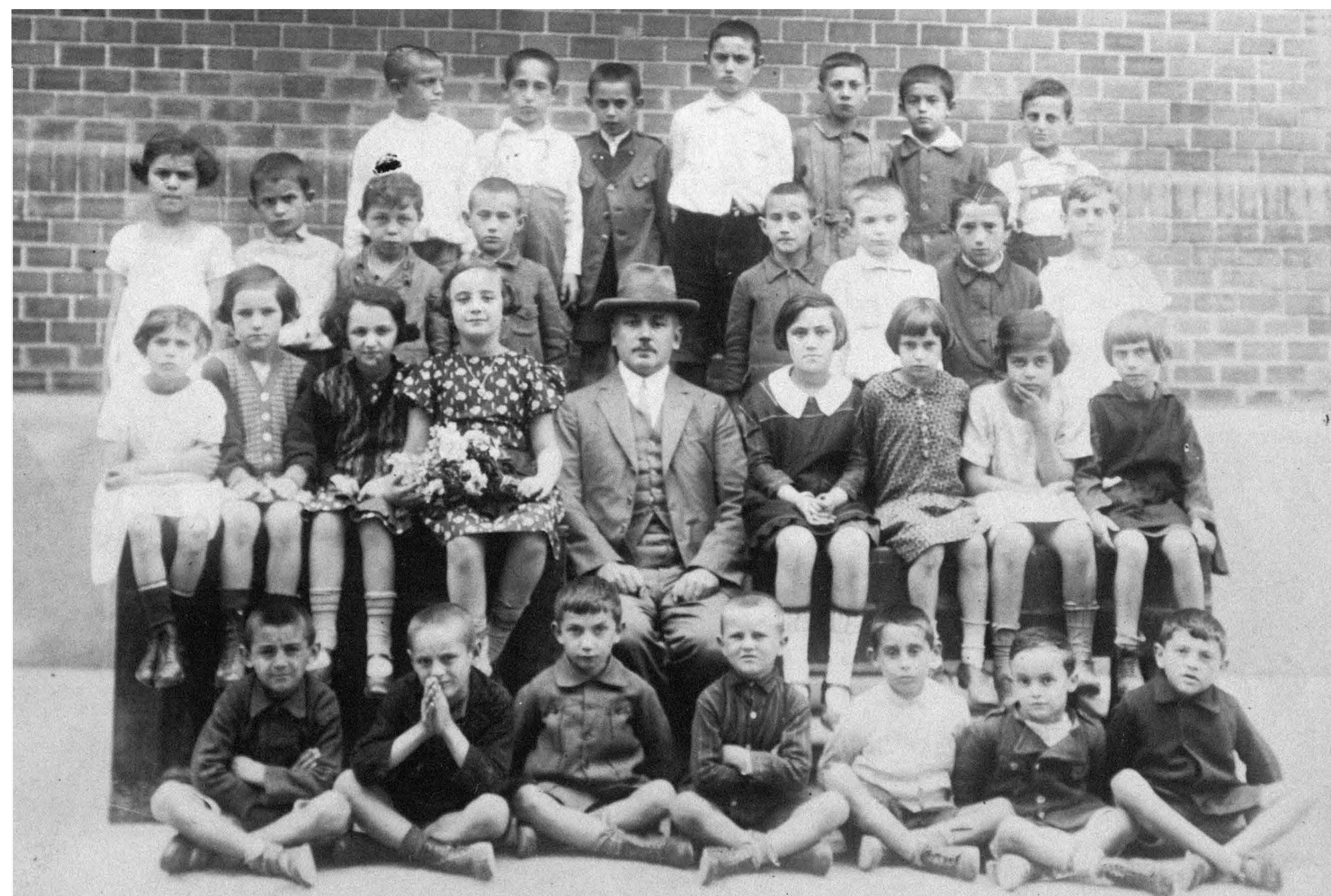
1. Odeljenje II razreda OŠ u Subotici, 1925. godine, sa većinski jevrejskom decom

„Imala sam 9 godina kad je počeo Drugi svetski rat, a dotle jedno lepo detinjstvo, u jednoj sređenoj porodici, takozvane one srednje klase današnje. Otac mi je bio apotekar, majka nije radila....I mnogo sam ponosna na tatinu porodicu, jer je ta porodica sa relativno ograničenim mogućnostima, a imala je puno dece za razliku od porodice moje majke, sva ta deca su fakultetski obrazovana, svi muškaci i tri devojke koje su sve završile veliku maturu. Ne mogu reći da smo bili previše religiozni. Svi su se praznici slavili, ali su se slavili i pravoslavni praznici.“