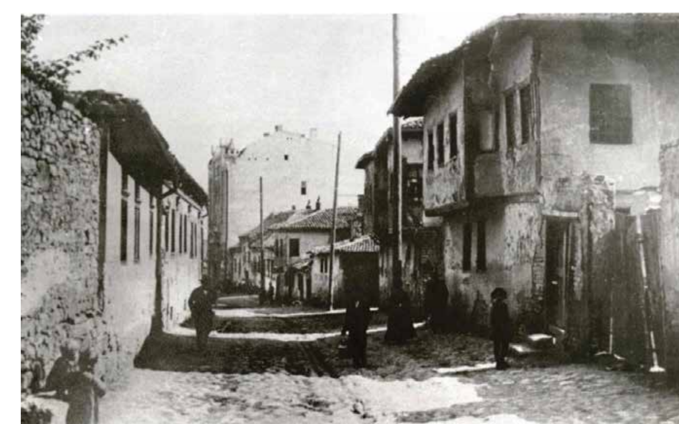
6. U Beogradu, većina Jevreja živela je na donjem Dorćolu, poznatijem kao Jalijska. Uslovi su bili teški jer je vladalo veliko siromaštvo. Samo mali deo jevrejske zajednice živio je u drugim delovima grada i bio imućnijeg statusa